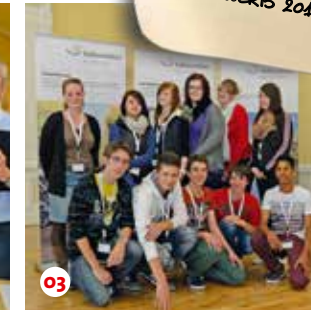
Abschlussveranstaltung „Spielemesse“ 01 Jury 02 TeilnehmerInnen 03

Ministerium für Klimaschutz, Umwelt, Landwirtschaft, Natur- und Verbraucherschutz des Landes Nordrhein-Westfalen